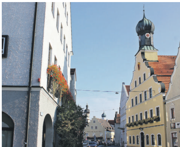
Von Grafing nach Glonn kommt man im September nur noch über die St2089 via Hohenthann.

Die Arbeiten werden voraussichtlich im Zeitraum vom 4. bis 29. September unter Voll-