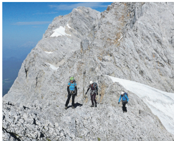
Immer wieder zieht es die Zornedinger Sektion in anspruchsvolles alpines Gelände. Hier im Dachsteingebirge.

Fortsetzung von Seite 1 führt die Tour, bei der 1.200 Höhenmeter in fünf Stunden zu überwinden sind. Es sind Trittsicherheit und Schwindelfreiheit erforderlich. Mit Bernd Hagl (Tel. 080 83/ 86 57) kann man am Mittwoch, 6. September eine gemütliche Bergtour auf den Bärenkopf (1.990 m) im Karwendelgebirge unternehmen. Von Pertisau geht es mit der Seilbahn zum Zwölferkopf und in vier Stunden Gehzeit über 500 Höhenmeter zum Gipfel. Wenn das Wetter passt kann anschließend noch im Achensee gebadet werden. Eine schwierige Mehrtageshochtour zum Großen Geiger (3.360 m) und zur Gamsspitz (2.888 m) in der Venedigergruppe führt Thomas Zanker (Tel. 00 43 / 66 48 / 56 37 10) von Freitag bis Sonntag, 8. bis 10. September durch. Die Touren dauern bis acht Stunden bei ca. 1500 Höhenmetern, dabei sind Gletscherausrüstung und Hochtourenenerfahrung am Gletscher sowie Kletterkenntnis bis Grad III in zwei Dreierseilschaften erforderlich.