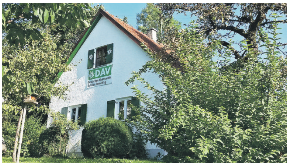
Schon an der Geschäftsstelle des Zornedinger Alpenvereins – der »Huiberghütt« – fühlt man sich den Bergen irgendwie ein Stückchen näher.

■ ZORNEDING · Auch wenn es heute mal nicht so aussieht – der September ist die ideale Zeit zum Bergsteigen. Die Temperaturen sind gemäßigt, die Tageslänge dauert noch über zwölf Stunden (zumindest bis zum 24. September) und das Wetter ist nicht so labil und gewitteranfällig wie noch im August. Grund genug also in die Berge aufzubrechen. Wer das lieber in einer Gruppe und mit professioneller Führung machen möchte, kann sich der DAV-Sektion in Zorneding anschließen. Insgesamt zehn vielseitige Wander-, Klettersteig- Kultur- und Bergtouren bieten die Zornedinger Alpinisten in diesem Monat an, bei denen auch noch eine Anmeldung möglich ist. Bereits heute führt Herrmann Obermaier seine Gruppe auf die aussichtsreiche Pyramidenspitze (1997 m) im Zahmen Kaiser. Wer diese Tour verpasst hat, überhaupt kein Problem. Be-